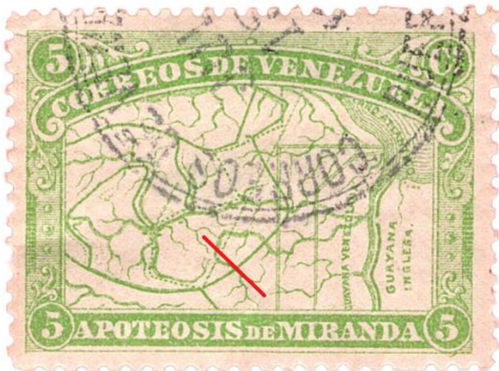
1896 Venezuela: claim on Essequibo. JAN HEIJS

Struggles about states are usually accompanied by discussions, diplomatic rows, border issues and sometimes even full-blown war. But also on tiny pieces of paper, the smallest expression of self-determination – stamps – these territorial claims are being fought.